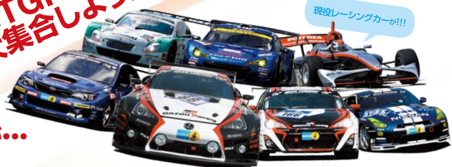
現役レーシングカーが!!!