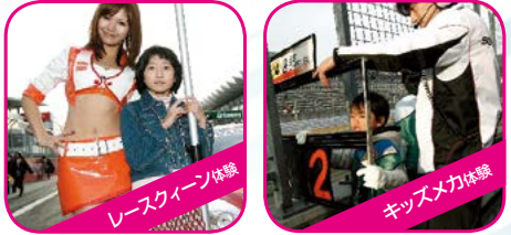
レースクイーン体験