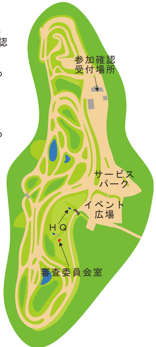
テクニクステージタカタ 全体図

レッキ終了後、工場の受付場所にて参加確認 その後、赤のルートでサービスパークへ戻る 車検準備を整えて、青いルートで車検へ その後、赤いルートでサービスパークへ戻る