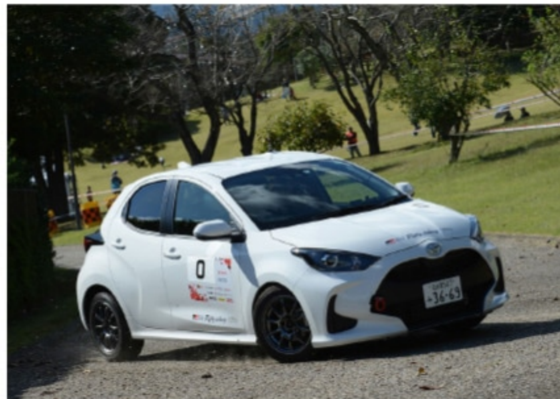
0 カー (ゼロカー) 【ゼッケン… 0】

競技車両 (101 号車) の 5 分前に、サイレンを鳴らしながら、競技車両と同様に全開走行でコースに問題が無いかを最終確認します。