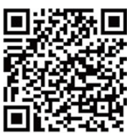
Google Play (Android)