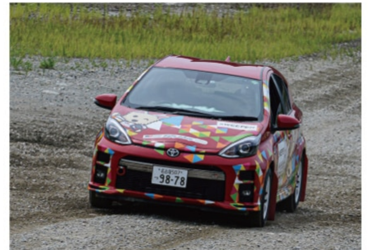
スイーパー 【ゼッケン… SWEEPER】

競技車両 (101 号車) の 5 分前に、サイレンを鳴らしながら、競技車両と同様に全開走行でコースに問題が無いかを最終確認します。