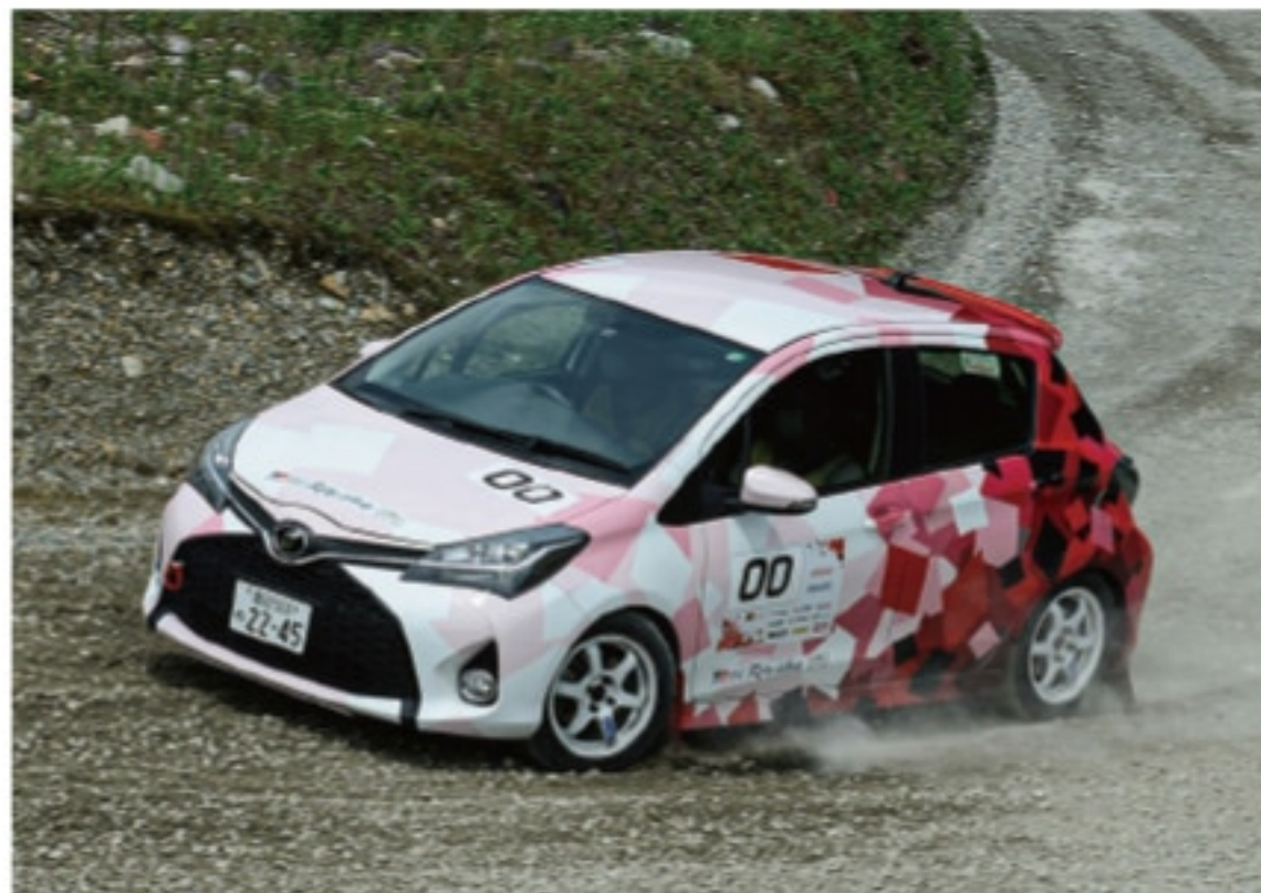
00 カー (ゼロゼロカー / ダブルゼロカー) 【ゼッケン… 00】