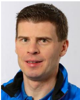
Miikka Anttila (ミーカ・アンティラ) コ・ドライバー

WRC 出場: 169回、WRC での勝利: 16回、表彰台: 57回、獲得ポイント: 1310、ステージ優勝: 466回