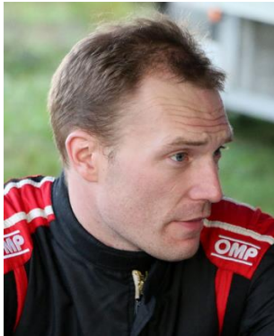
Jari-Matti Latvala (ヤリ-マティ-ラトバラ) ドライバー