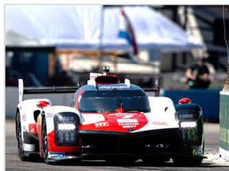
ル・マン24時間耐久レースが有名な世界トップの耐久レース