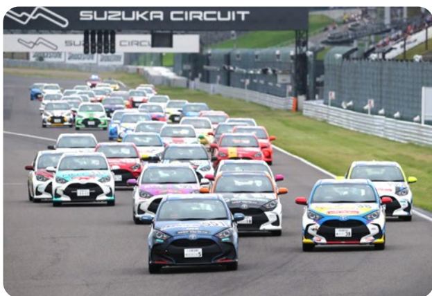
TOYOTA GAZOO Racing Yaris Cup 参加用車両

“Yaris Cup”は、2000年から21年間開催されたVitz Raceの歴史を引継ぎ、2021年からスタートしたJAF公認ナンバー付車両による参加型ワンメイクレースです。2024年シーズンは全国を地域ごとに5つのシリーズに分け、7つのサーキットを舞台に開催。充実のサポート体制でモータースポーツに初めてチャレンジする皆さんの参戦を応援します。